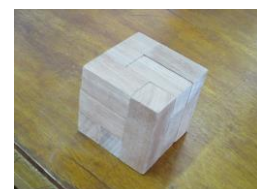
1年技術の作品です