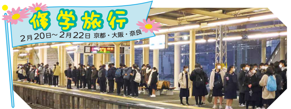
~晴れやかな表情の子どもたち、待望の修学旅行へ~