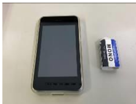
貸出し用のモバイルルーター

先週の週末、生徒に1台ずつ貸与されているタブレット端末（クロームブック）を生徒が持ち帰りました。目的は家庭でタブレットがインターネットにつながるかを調べることで、今後、状況によっては家庭でのリモート学習も予想され、その試用をすることです。2、3年生はすでに授業で使用する機会も多くありましたが、1年生にとっては、まだあまり活用できていない中での持ち帰りとなりました。その後のアンケートではほとんどのご家庭が家庭でのWi-Fi環境で問題なく接続することが分かりました。市では今回の調査ですべての家庭でリモート学習がスムーズに行えるかを調べています。アンケート調査にご協力ください。また、インターネット環境がご家庭に無い場合は市からモバイルルーター（設備工事なしでインターネットが使える機器）の貸し出しがありますので、ご利用ください。