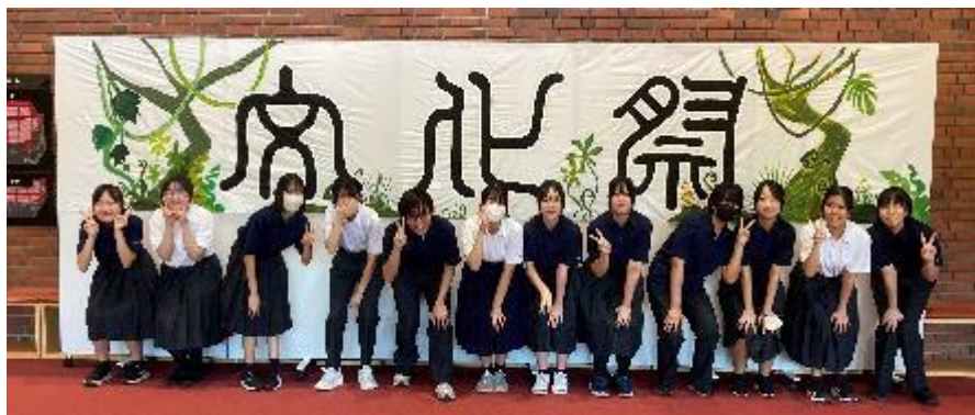
美術部は、素敵な垂れ幕の紹介をしてくれました。