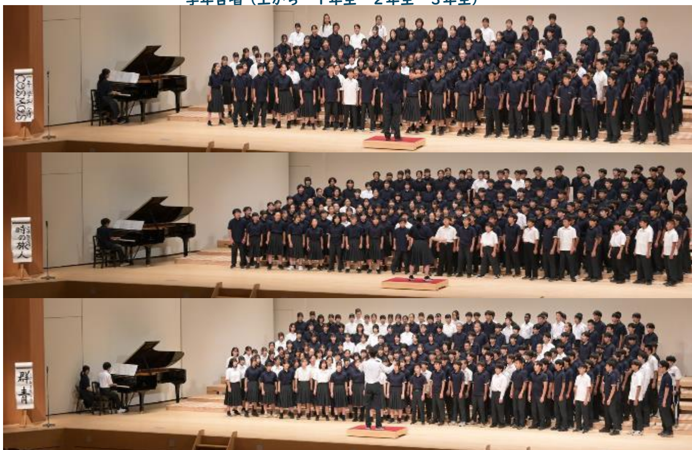
学年合唱（上から 1年生 2年生 3年生）

9月26日（金）、厚木文化会館で今年度の合唱コンクールが行われました。初めて使用をする会場でしたが、本厚木駅から会場まで、PTAのイベントサポーター（以下イベサポ）の皆様が誘導していただけたおかげで、時間通りに開会式を迎えることができました。また、帰宅時にも多くイベサポの方に見守られて安全に移動することができました。ご協力ありがとうございました。また、当日は、多くの保護者の皆様に鑑賞いただきありがとうございました。