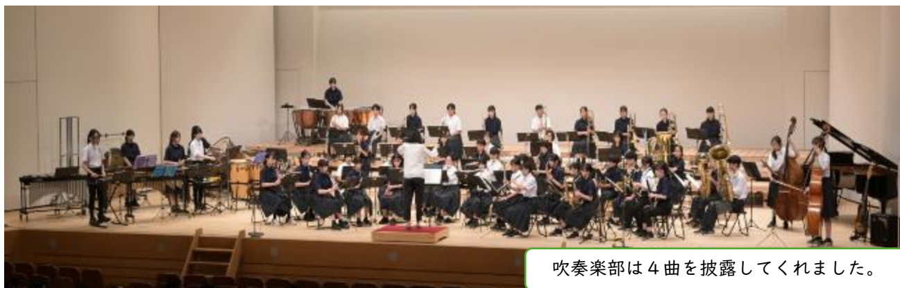
吹奏楽部は4曲を披露してくれました。