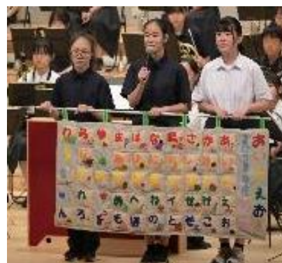
家政部は、あいうえお表の披露をしてくれました。